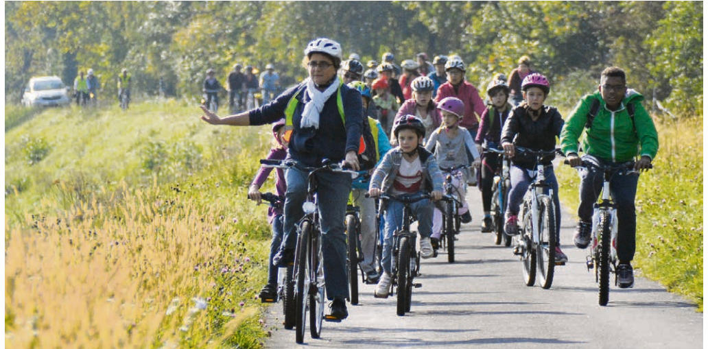
Aigle - Yvorne - Corbeyrier A vélo en direction du culte d'ouverture du KT et de l'enfance.

AIGLE - YVORNE - CORBEYRIER Mardi 21 novembre, à 20h15, à la chapelle Saint-Jean. Ordre du jour statutaire et approbation du budget 2018. Venez nombreux vous informer sur la vie de la paroisse !