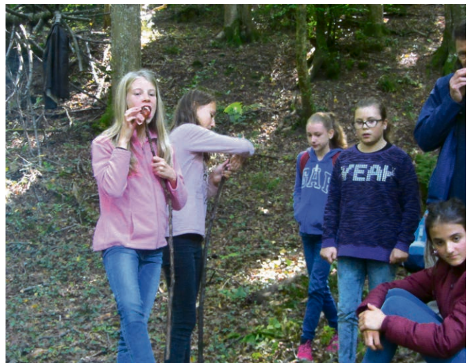
Services communautaires Incontournables, les cervelas grillés sur le feu.