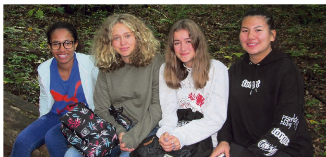
Villeneuve - Haut-Lac Sourires de catéchumènes au week-end 9-10 du Bouveret.

Comme l'an passé, les paroisses évangélique réformée et catholique, la communauté évangélique, ainsi que l'Assemblée de Dieu à Villeneuve se lancent ensemble dans ce beau projet : préparer des paquets de Noël pour enfants ou adultes en Europe de l'Est. Les colis seront rassemblés par canton et acheminés jusqu'à leurs destinataires par les soins de la Mission chrétienne pour les pays de l'Est. Vous trouverez les listes de marchandises et les lieux de dépôt dans notre Région sur les papillons déposés dans les différentes églises (renseignements auprès de vos pasteurs). (voir rubrique Actualités). Du 1 er au 26 novembre.