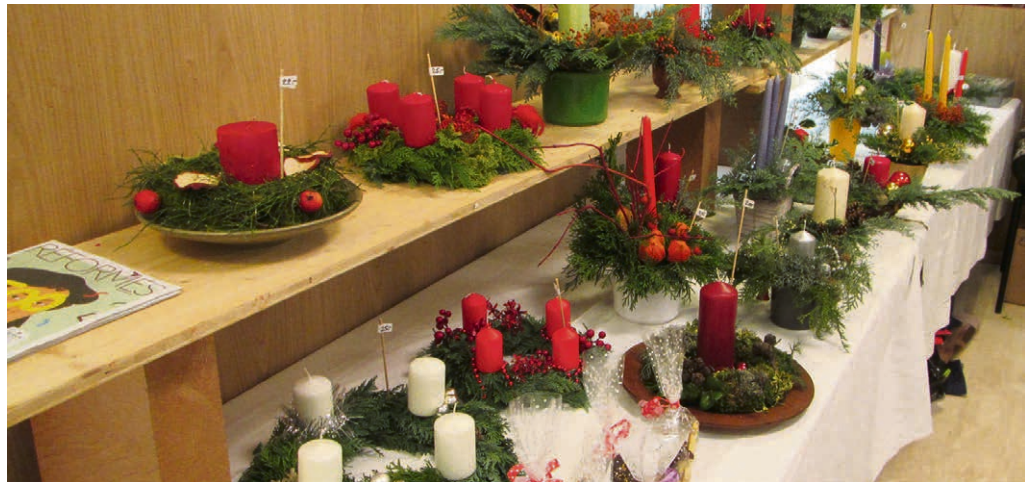
Kirchgemeinde Est Vaudois - Vevey - Montreux - Aigle Bazar in Montreux.

ret für internierte Franzosen aus dem deutsch/französischen Krieg. Die speziell zu diesem Anlass erstellte Festschrift gibt einen weiteren Einblick in die Geschichte der Kirche. Im Anschluss an den Gottesdienst gemütliches Zusammensein und Austausch beim Aperitif.