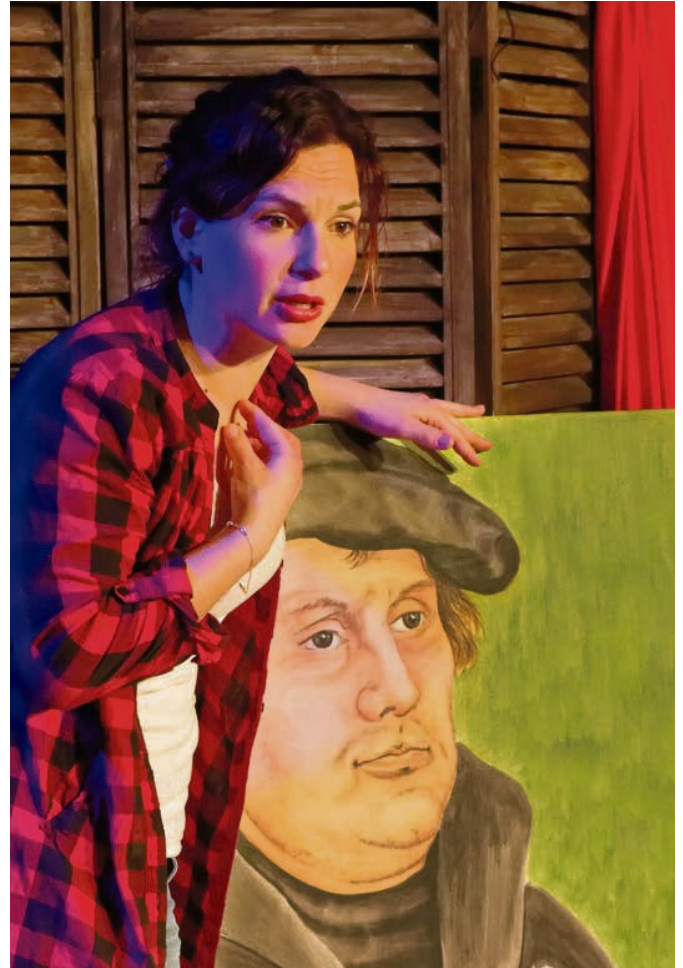
Avançons «Painting Luther» par la Compagnie La Marelle.

Une année pour parcourir l'Évangile de Marc à travers la lecture, l'écoute, le silence et le partage de la cène : samedi 18 novembre, à 18h, à la chapelle des Posses.