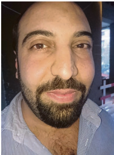
Services communautaires Irhaman