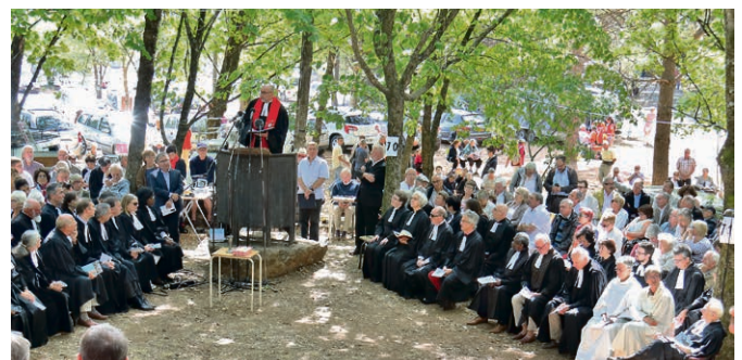
Ormonts - Leysin Assemblée du Désert du 3 septembre : y reconnaissez-vous certains ministres ?