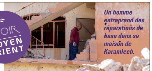
Un homme entreprend des réparations de base dans sa maison de Karamlech.

» Portes Ouvertes travaille en Irak depuis plus de vingt ans. Entre 2014 et 2016, en collaboration avec nos partenaires, nous avons soutenu des centaines de milliers de chrétiens avec du secours d'urgence.