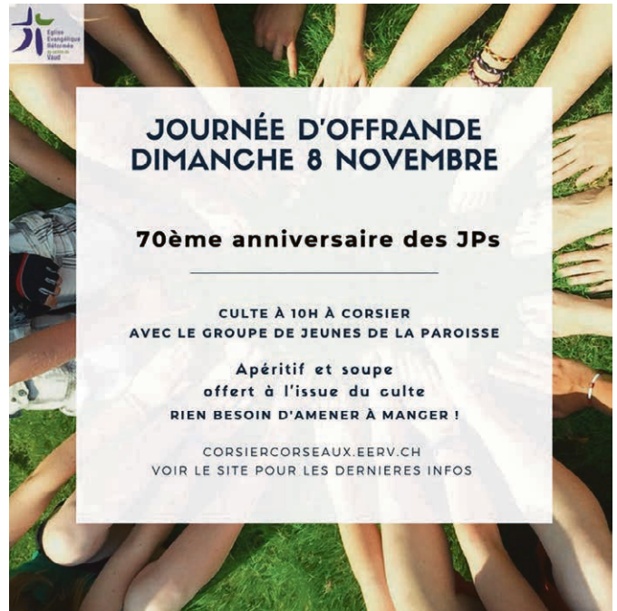
La paroisse en fête.

Organisé par les paroisses de Corsier – Corseaux et