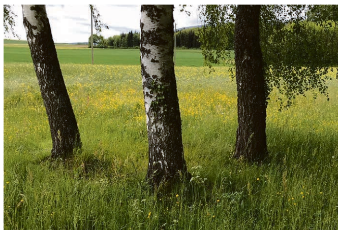
Lieu paisible en forêt.

À la mesure que le sujet est refoulé dans nos sociétés occidentales, des nouvelles pratiques funéraires n'ont cessé d'émerger. Depuis 2016, le Toussaint'S-Festival décrypte ces rites autour de la mort et la quête du sens qui s'y dévoile. La société s'approprie les rites anciens et les réinvente. Le rituel individualisé est souvent réservé à un petit cercle d'élus et non pas à une large communauté qui connaissait le défunt. Force est de constater que même face à la mort, il faut se distinguer par l'originalité : un défunt musicien qui se faisait inhumer dans un cercueil en forme d'étui à guitare, un jeune homme qui sniffait les cendres de son père en même temps que sa dose quotidienne de cocaïne, les cendres dispersées au pied d'un arbre ou sur le lac – la Suisse est l'eldorado de telles pratiques avec une législation moins restrictive qu'ailleurs – sans oublier la photographie post-mortem pour garder une image paisible du défunt, autant d'exemples qui donnent à