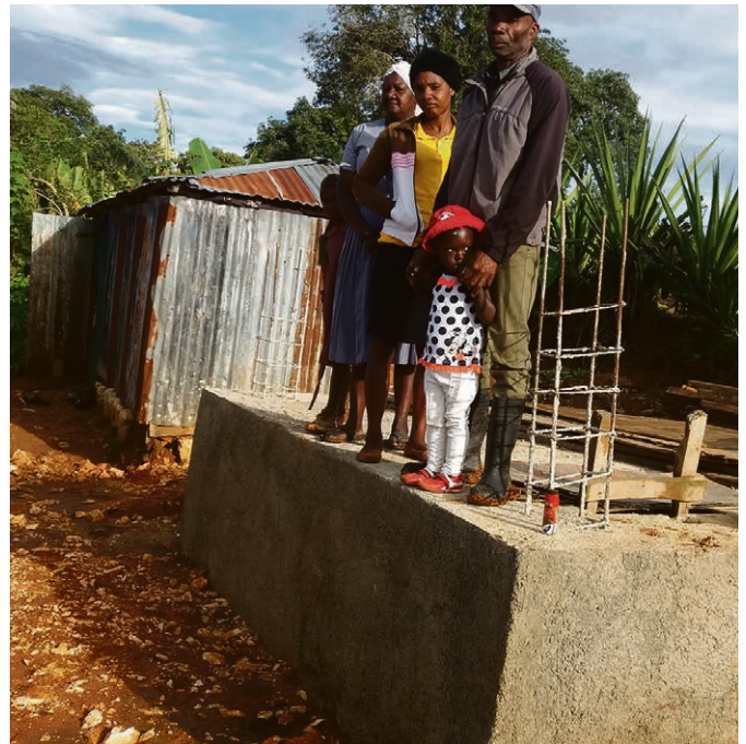
Première citerne construite.