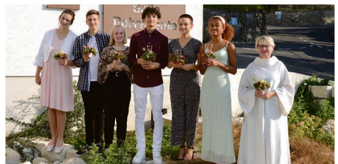
Fête de bénédiction des catéchumènes.

Vendredi 6 novembre, de 17h à 20h, Centre Sainte-Claire, Vevey. Avec le pique-nique. « Les témoins de la foi ».