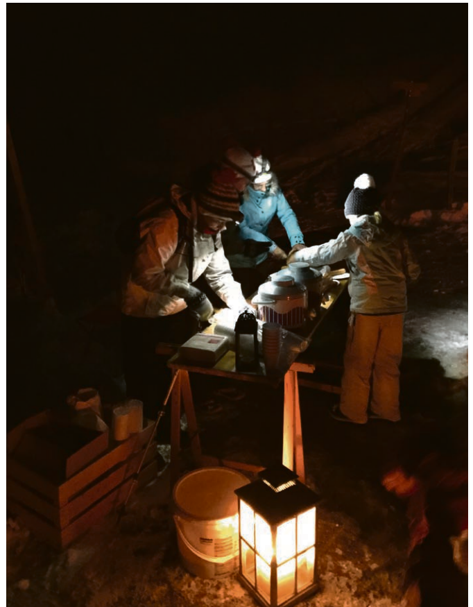
Le feu est la moitié de la vie. Bienvenue pour le feux de l'Avent 2020.