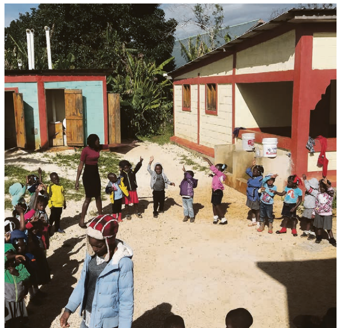
Retour à l'école !