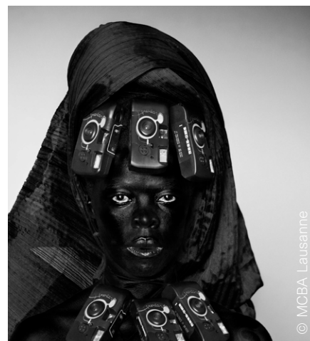
Zanele Muholi, Thathu I.

« Résister, encore », jusqu'au 15 mai, MCBA, www.mcba.ch .