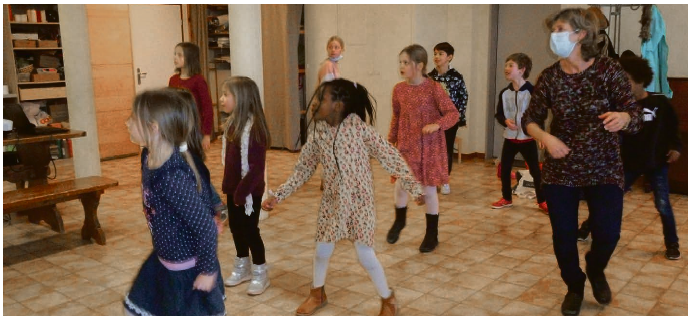
Au Culte de l'enfance, c'est chouette!