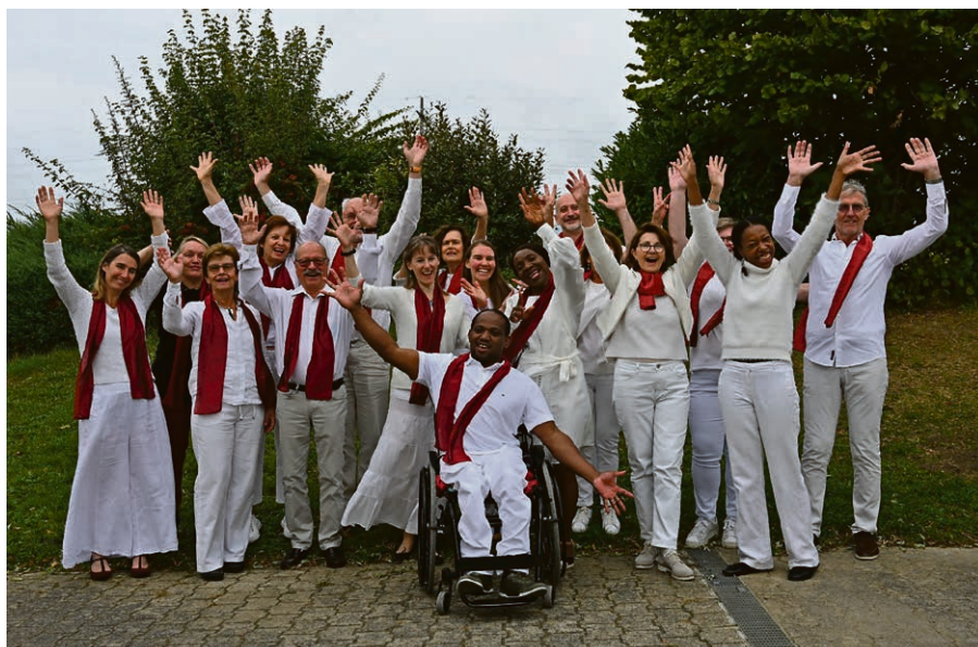
La chorale Let's Gospel.