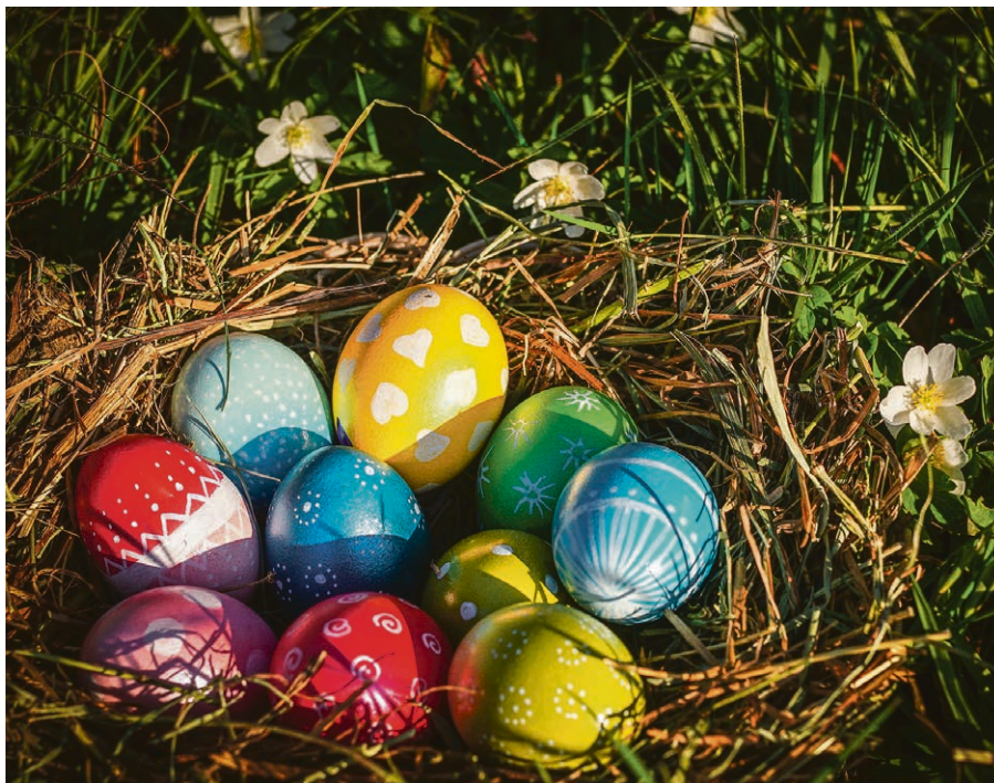
Chasse aux œufs, chocolat, espoir et joie.

Les jeunes de la Région La Côte nous parlent de Pâques et de la résurrection.