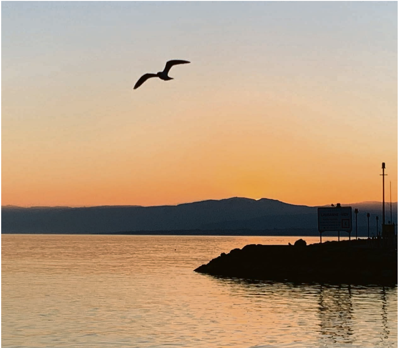
Frieden und neues Leben leuchten auf.