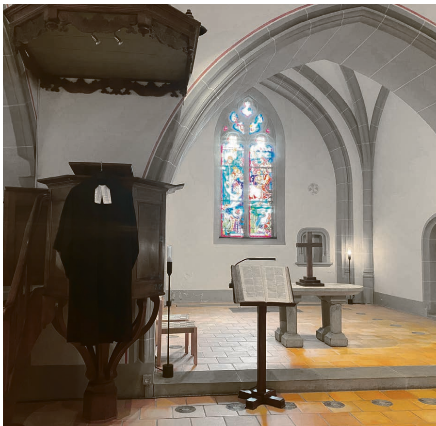
En savoir plus sur le culte protestant grâce à « C'est culte ».

Vendredi-Saint 15 avril, à 17h , au temple de Nyon. « Leçons de ténèbres » de F. Couperin.