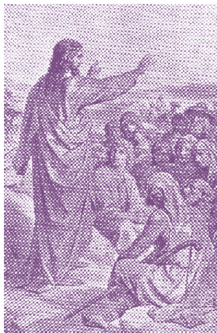
Jésus a transmis son enseignement par oral, comme ici lors du sermon sur la montagne.