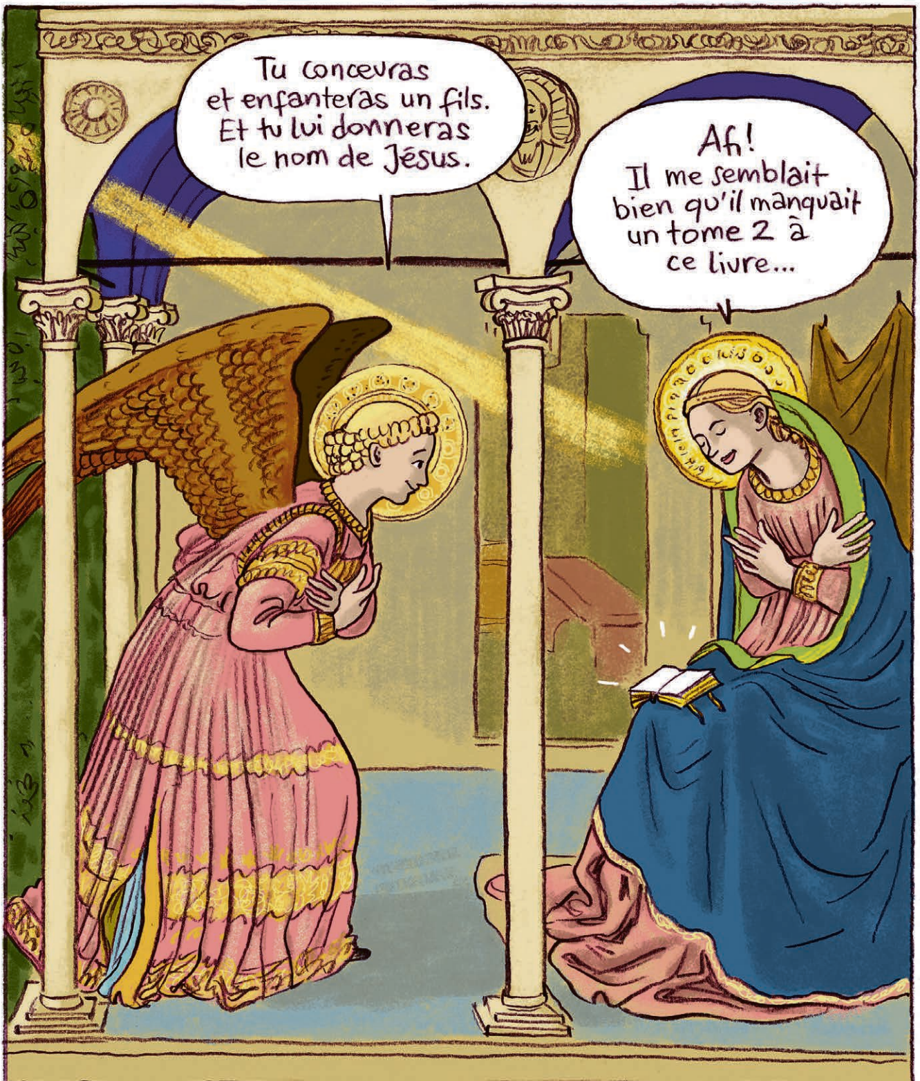
D'après "L'Annonciation" de Fra Angelico (1400-1455)