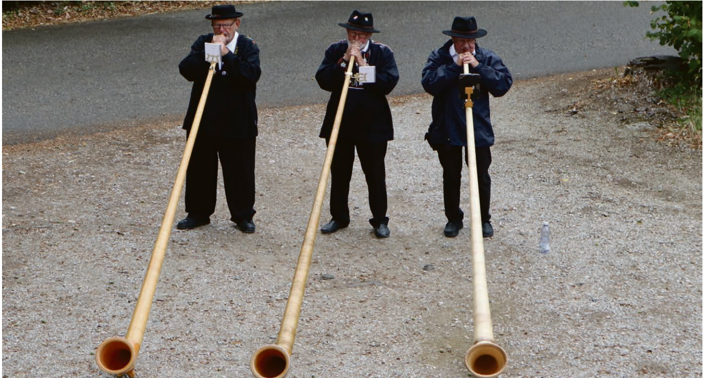
Alphornbläsertrio am Schweizertag.