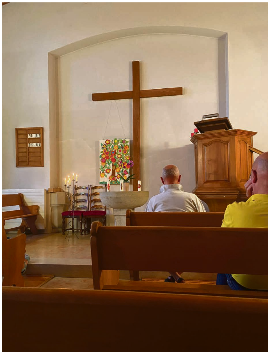
Au temple de Berolle, comme à Sévery, l'Espace Souffle est l'occasion de se ressourcer.

Week-end du 30 septembre et 1 octobre , la Nouvelle-Lune, à Saint-George accueillera les jeunes dès 14 ans (dès la 11 e ). Un parcours 3D (Découvrir, Discerner, Développer) est proposé à celles et à ceux qui