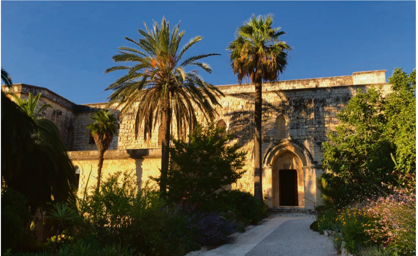
Eglise de Sainte-Marie de la Résurrection dans le village d'Abu Gosh, lieu probable de l'Emmaüs biblique. Là où les disciples ont été rejoints par le Christ ressuscité, une communauté de frères et de sœurs bénédictins invite les pèlerins à cette même joie de la rencontre avec le Christ.