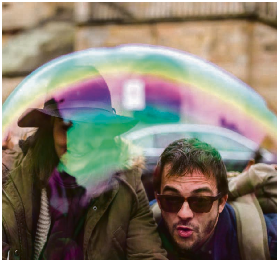
Le programme 2022-2023 est arrivé!

À l'écoute des besoins des personnes accueillies et des familles qui hébergent. En collaboration avec les différents partenaires sociaux. Contact : 079 192 46 42.