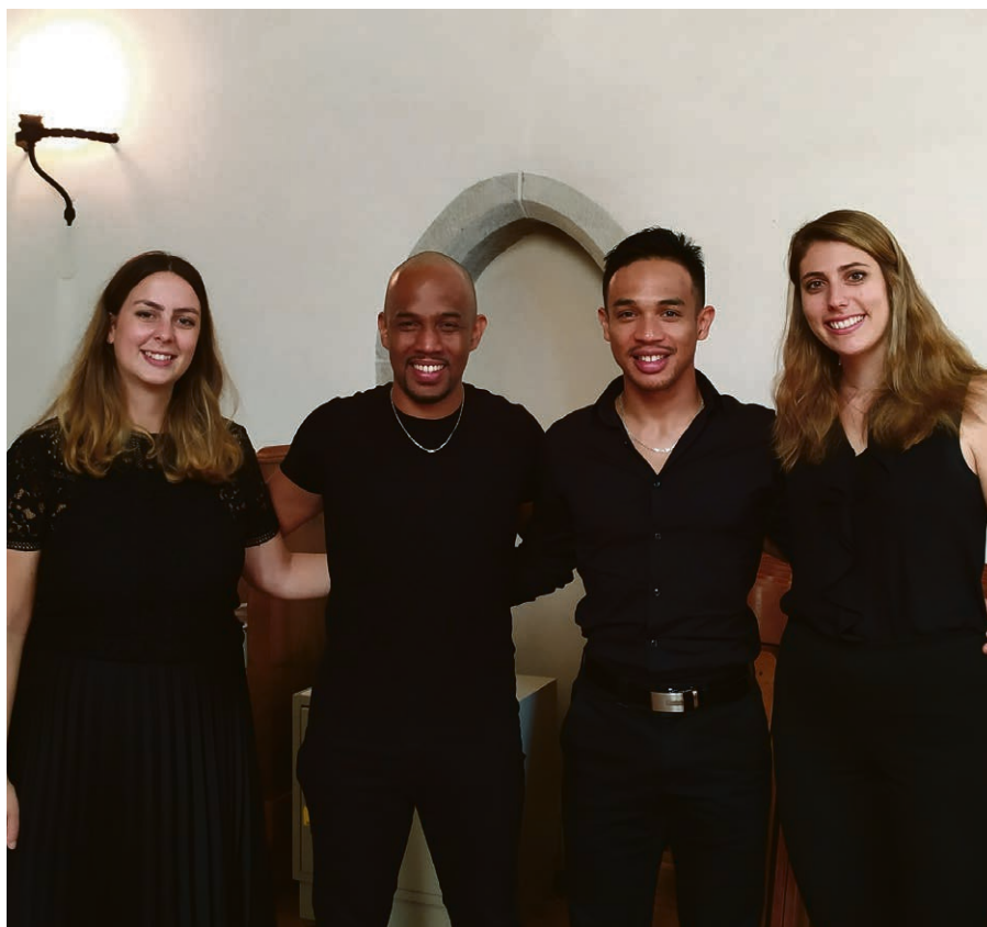
Comme une note d'espérance avec « Plagal ».

Comme le veut la tradition, c'est un invité choisi par les ministres qui apportera la prédication. Nous aurons la joie d'écouter le message d'Olivier Bauer,