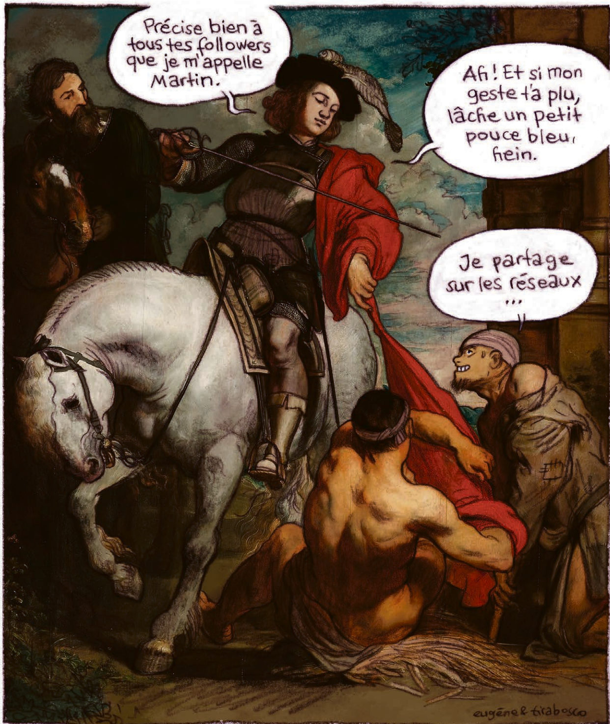
D'après « Saint Martin et le mendiant » de Antoine van Dyck, 1618