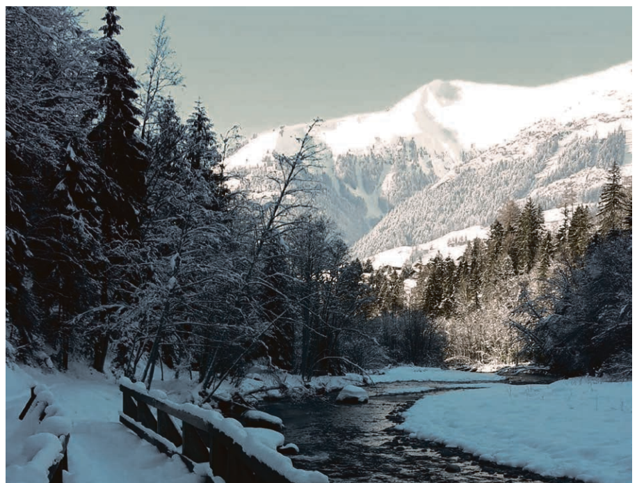
Croire à la lumière.