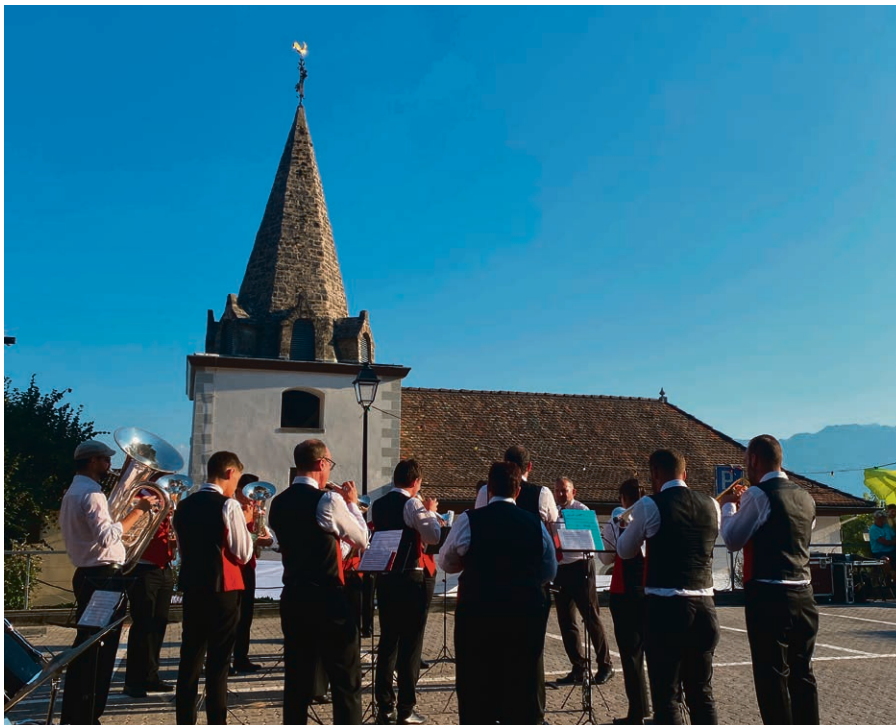
Merci à la fanfare.

Quelques images de cette belle journée, pour nous laisser porter par l'énergie de ces bons moments. Encore merci à tous ceux qui ont organisé, vécu cette belle fête avec nous !