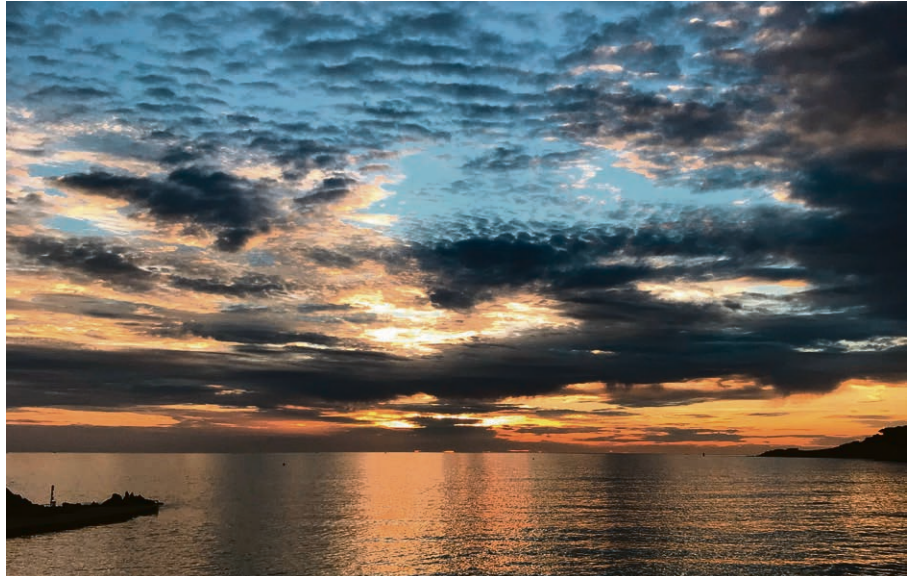
L'espérance traverse les nuits les plus profondes.

Samedi 2 décembre, à 17h , à l'église allemande, rue du Panorama 8 à Vevey. L'occasion d'entrer en chantant dans le temps de l'Avent, avec les communautés anglophones et germanophones.