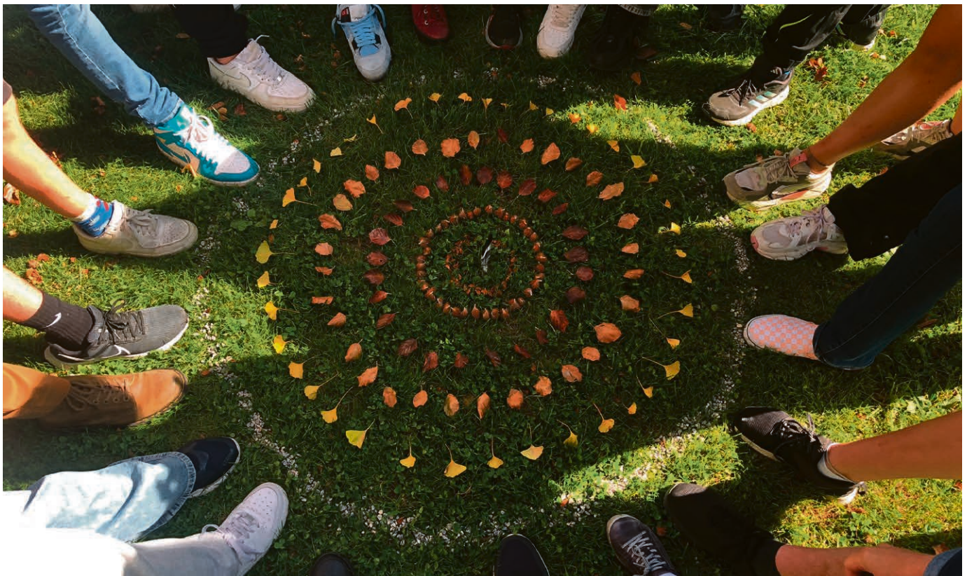
Land Art à la sortie régionale de catéchisme.

PAYS-D'ENHAUT Dimanche 3 décembre, Avent I, 10h , L'Étivaz. 18h , Château-d'Œx et L'Étivaz, feux de l'Avent. Dimanche 10 décembre, Avent II, 10h , Rougemont. Dimanche 17 décembre, Avent III, 10h , Château-d'Œx. Dimanche 24 décembre, Avent IV, 10h , Rougemont. 20h , L'Étivaz, fête de Noël. Lundi 25 décembre, 10h , Château-d'Œx, cène. 20h , Rougemont, fête de Noël. 20h , Rossinière, fête de Noël. Mardi 26 décembre, 20h , La Lécherette, fête de Noël. Dimanche 31 décembre, 10h , Rossinière. Dimanche 7 janvier, 10h , L'Étivaz. Dimanche 14 janvier, 10h , Rougemont. Dimanche 21 janvier, 10h , Château-d'Œx, célébration œcuménique (lieu à confirmer). Dimanche 28 janvier, 10h , Rossinière, cène. ▲