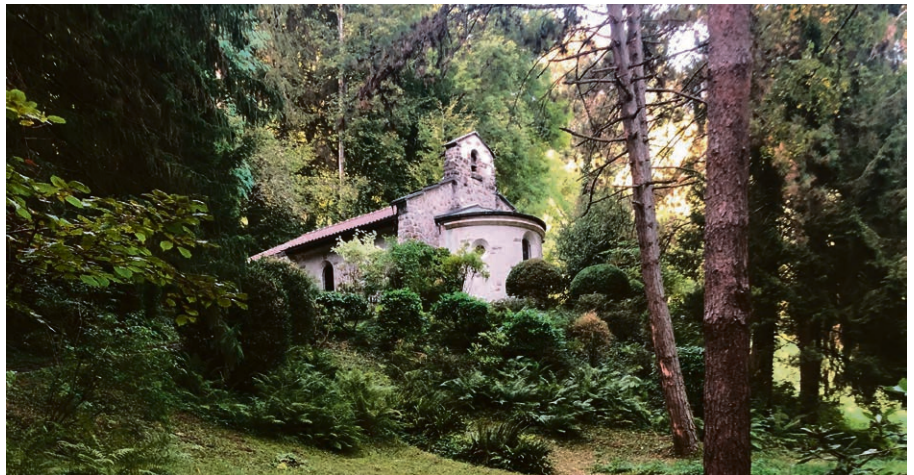
La chapelle dans la réserve naturelle de La Grant Part.