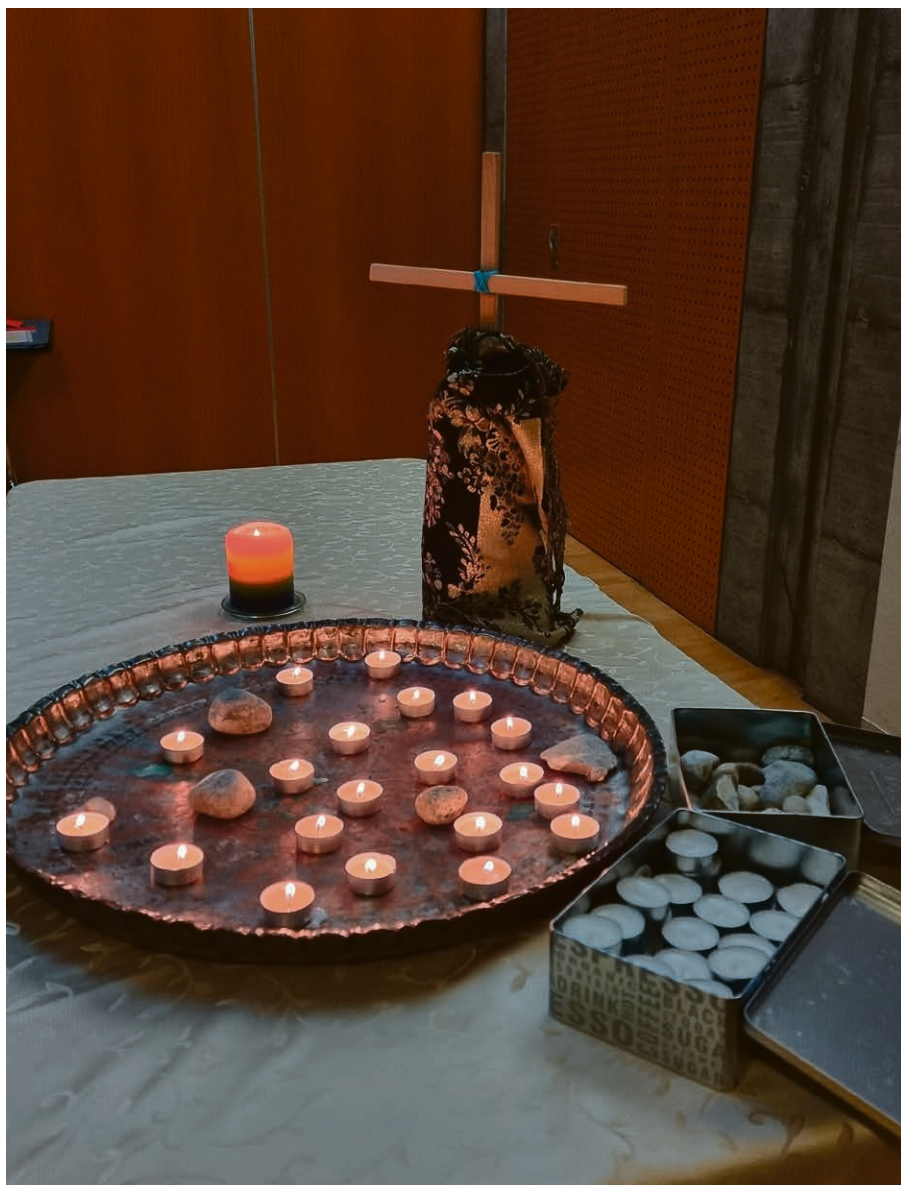
La prière d'intercession est un moment essentiel des célébrations Oasis nomade.

Si vous ne pouvez venir, il est possible de déposer une prière sous forme d'un caillou ou d'une bougie via le site https://www.esriviera.ch .