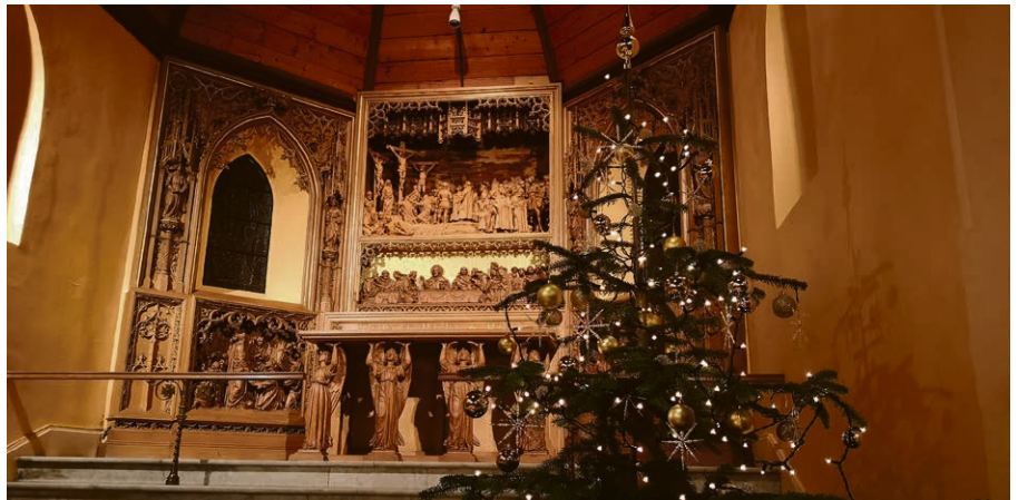
Veillée de Noël à la chapelle de Caux en 2022.

Dimanche 24 décembre , il n'y a pas de culte en matinée à Montreux, mais les veillées de Noël vous accueillent à 17h, à Veytaux, à 18h, à Caux et à 23h, à Saint-Vincent.