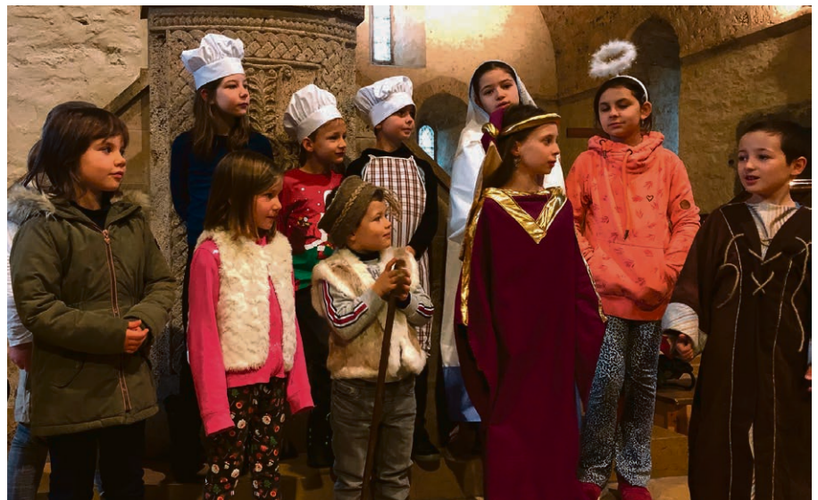
Souvenir du Noël des enfants 2022.