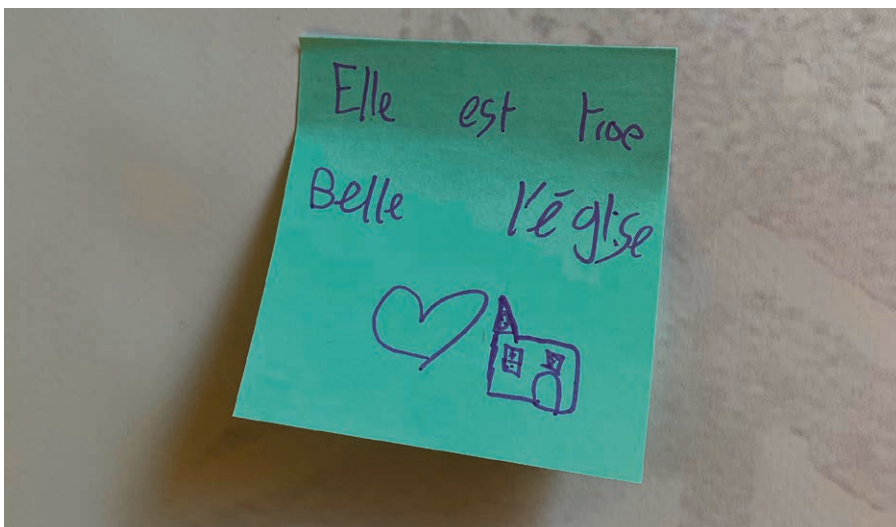
Merci aux enfants.