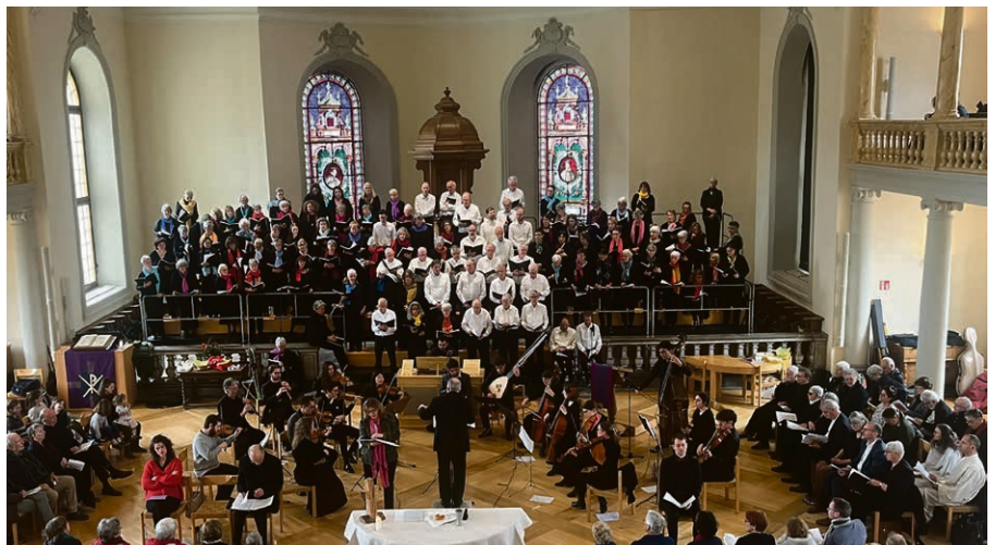
Le temple de Morges était plein lors du culte de Vendredi-Saint magnifié par le chœur, les solistes et l'orchestre de Passion 2024.