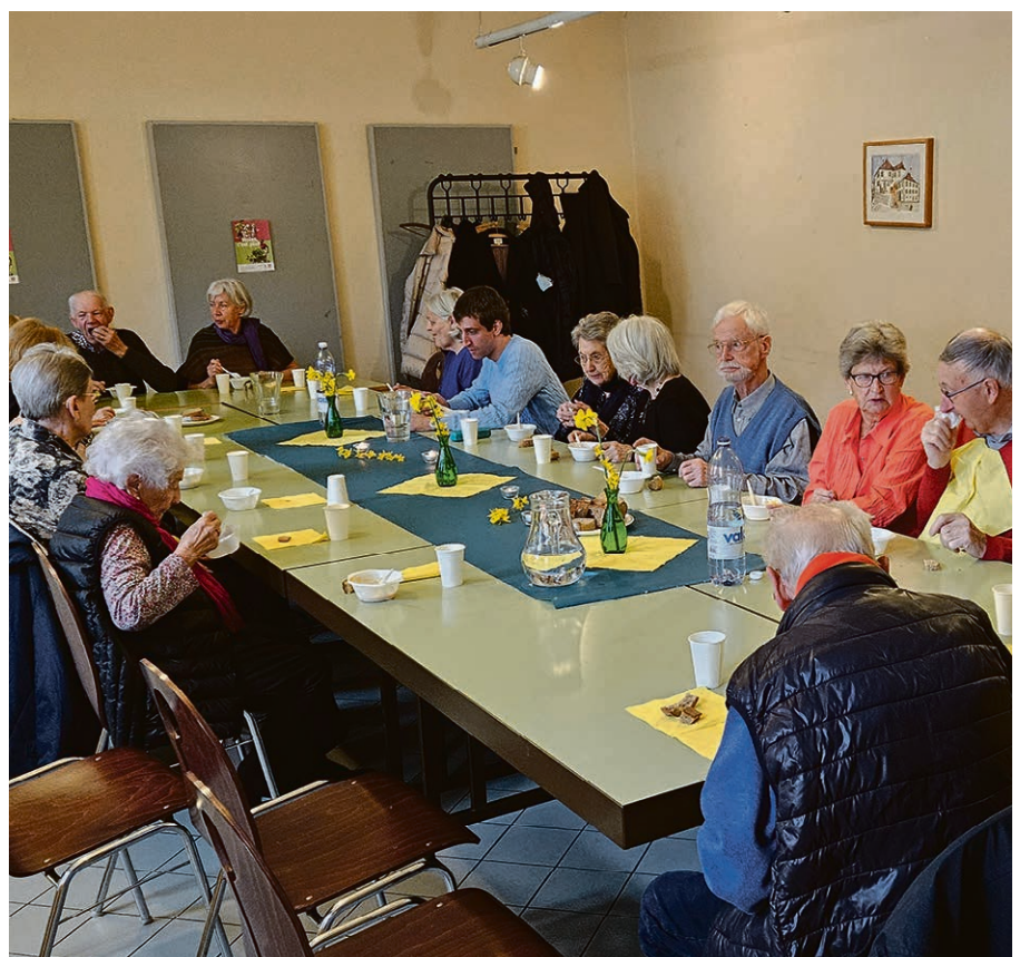
« Moins, c'est plus! », ou quand des soupes deviennent un festin partagé