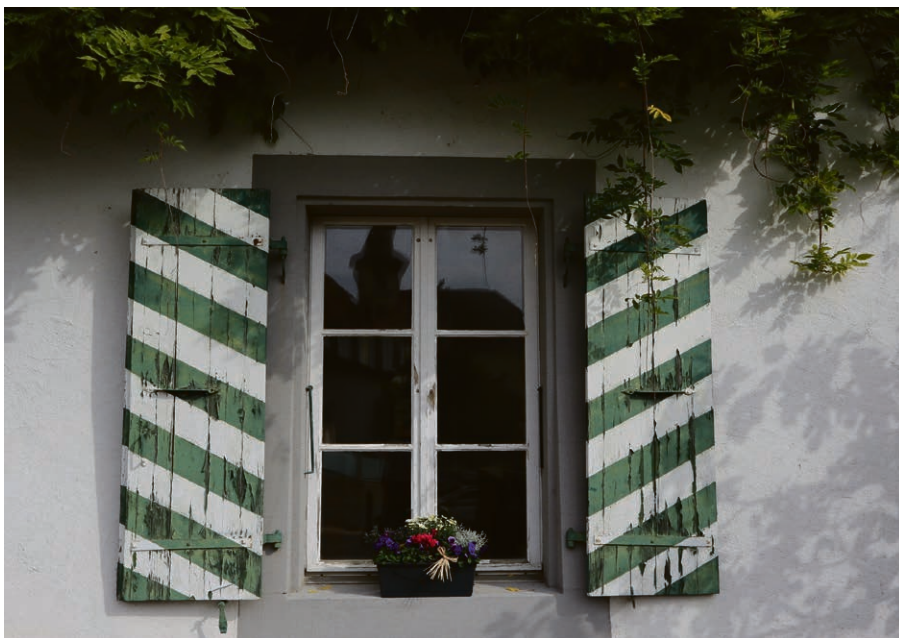
La cure avec vue.

animalier ou reportage. Contact auprès d'Elianne Crottaz au 021 801 22 63.