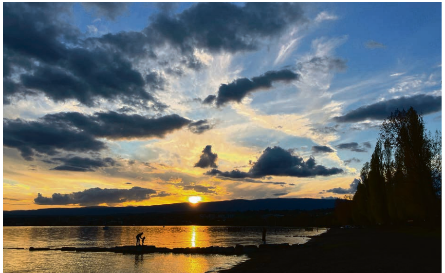
Crépuscule poétique le 14 mai: contempler, écrire et partager la flamme.

Mardi 28 mai, de 19h30 à 21h30 : marche contemplative entre campagne et forêt à Yens. Informations détaillées et inscriptions: renaud.rindlisbacher@eerv.ch – www.aurendezvousdelanature.com .