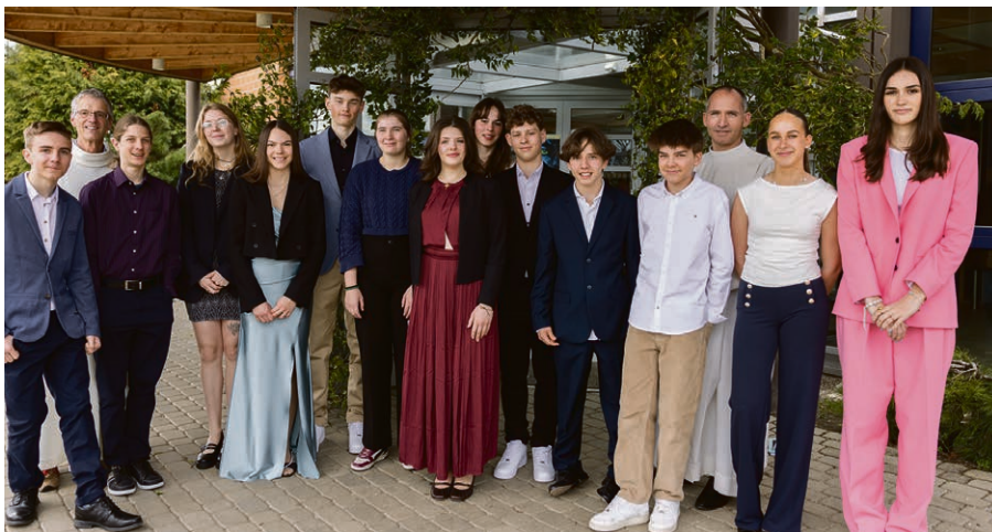
Jeunes devant la salle polyvalente lors du culte des Rameaux.