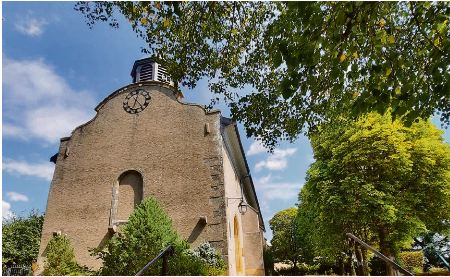
Un magnifique temple de Pampigny fraîchement restauré accueillera les 3 cultes radio. Celui du 5 mai sera suivi d'une journée festive d'inauguration.

Mezzo et Laurent Jovet, orgue et clavecin) présentera deux cantates pour voix soliste et accompagnement. Une belle façon de commencer la fête d'inauguration du temple de Pampigny.