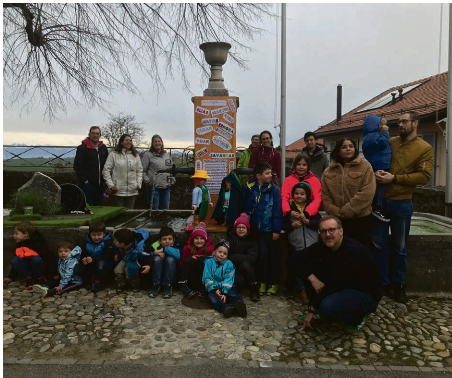
Culte à 4 pattes du samedi 2 mars, décoration de la fontaine de la place de l'église, tombeau de la résurrection.

cepté de s'engager en tant que secrétaire de l'Assemblée de paroisse. Le conseil leur réitère ici toute sa reconnaissance.