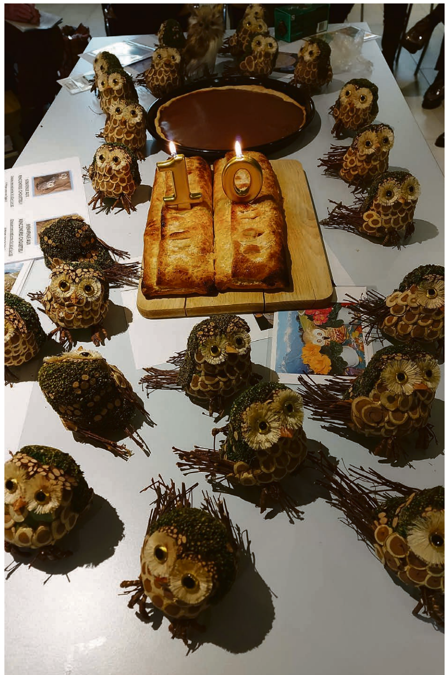
Les 10 ans du groupe Chouette.