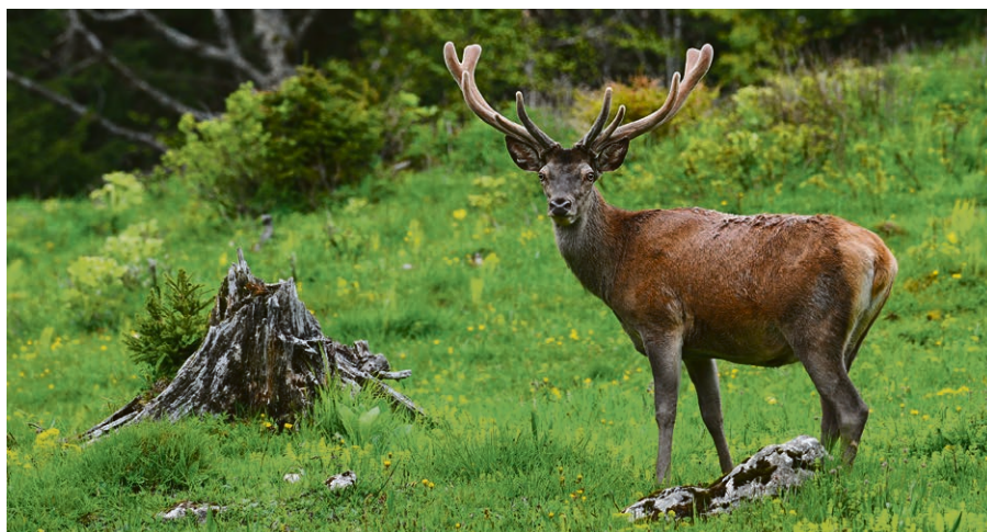
Émerveillement, ressourcement : les valeurs clés des activités proposées par Renaud Rindlisbacher.

La contemplation, la patience, le silence et la confiance sont des valeurs fondamen-