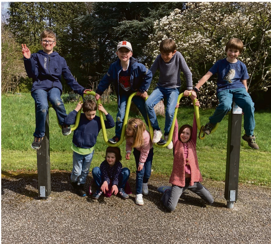
Module de Pâques, une partie des 23 inscrits.