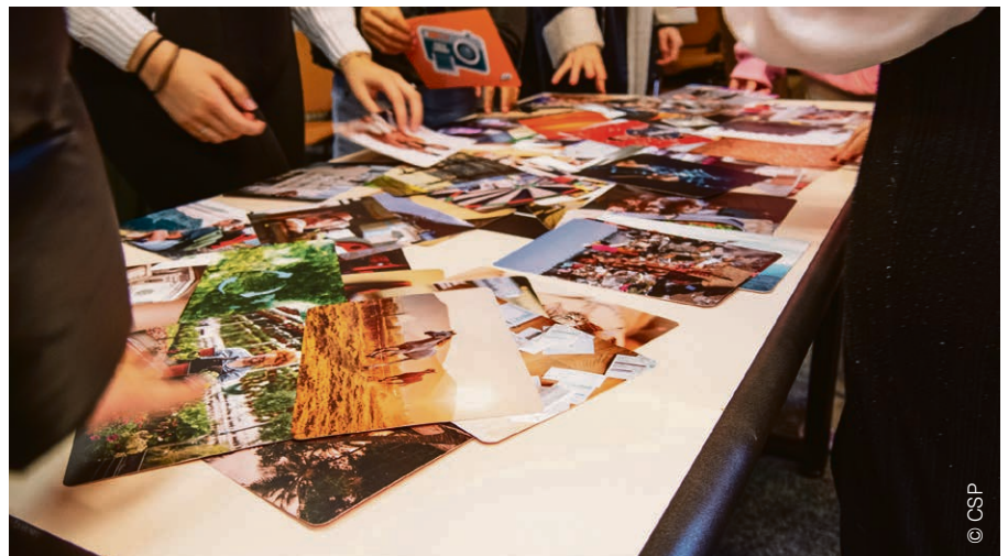
Au cours d'un atelier de prévention du surendettement auprès des jeunes, en novembre 2023. Les jeunes choisissent une image du photolangage pour parler librement de ce que cela évoque pour elles et eux, en lien avec l'argent.

La pauvreté des jeunes n'est pas due à une question de responsabilité personnelle, même si la « culture de la consommation, les paiements réalisés de plus en plus facilement et de manière