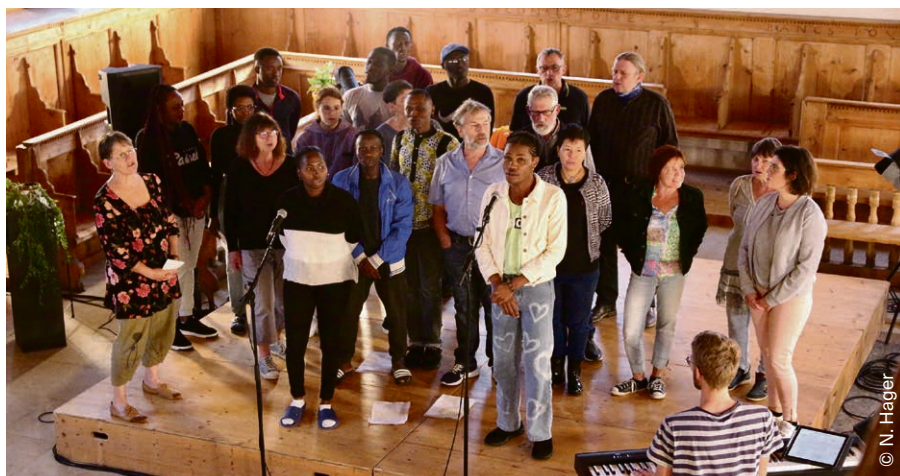
La choré P'tit val Grand Cœur regroupe migrant-es et population du village.