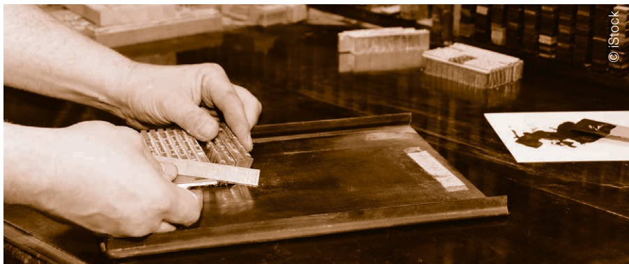
La Linotype permettant la saisie au clavier et la fabrication de lignes de caractères en plomb a révolutionné l'imprimerie de la fin du XIX e siècle. Elle a été utilisée jusqu'à la fin des années 1970.

Des milliers de pages de Croire , Bonne Nouvelle , Le Semeur , Le Ralliement , Le Lien ou d'autres sont désormais accessibles gratuitement sur le site de Scriptorium. Elles ont été soit numérisées et rendues recherchables en plein texte, soit les éditeurs des documents les plus récents ont fourni directement des fichiers informatiques. Les Réformés jusqu'en 2022 sont ainsi proposés sous une forme regroupant les différentes pages régionales.