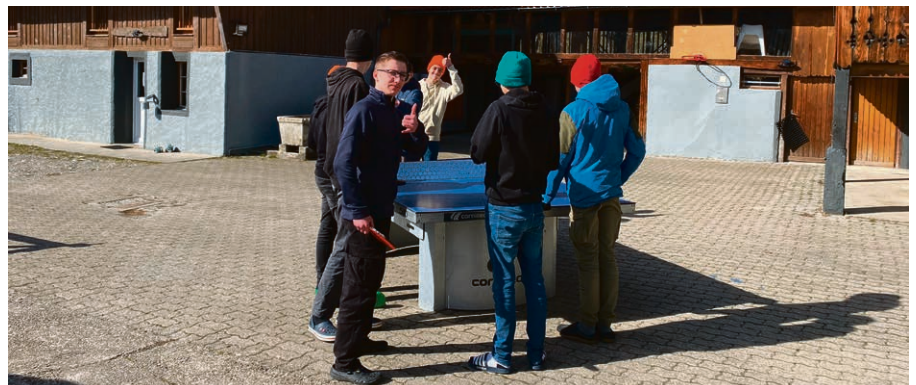
Il y a encore du temps pour jouer.