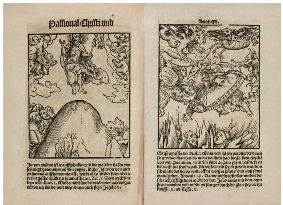
L'Ascension, de Lukas Cranach. © Illustration tirée du livre de Christof Warnke, Die Bibel ist nicht vom Himmel gefallen, Stuttgart: Steinkopf, 1990