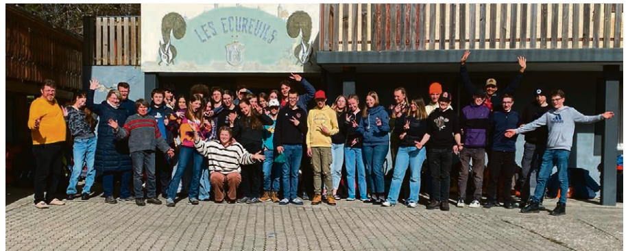
Une belle équipe.