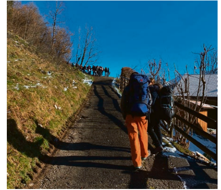
Pour se retrouver, il faut s'éloigner.