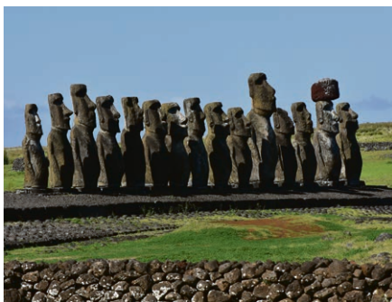
Île de Pâques.

Il n'y aura pas de culte dans notre paroisse. Si vous avez besoin d'un transport, veuillez vous adresser au secrétariat.