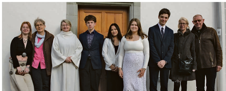
En souvenir de la fête des Rameaux dimanche 24 mars.