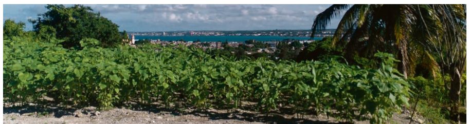
Un jardin communautaire, projet de l'un des quatre partenaires de DM avec la baie de San Nicolás de Bari en arrière-plan.