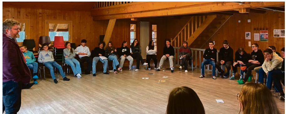
De la réflexion : ça fume !